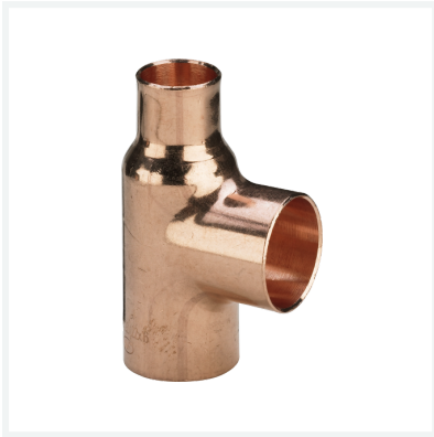
T-Stück - Lötanschlüsse Modell 95130