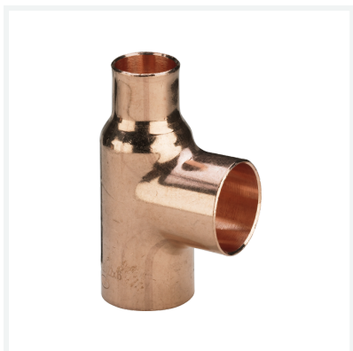
T-Stück - Lötanschlüsse Modell 95130