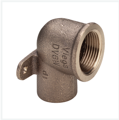
Wandscheibe Modell 94472G Artikel 100 223