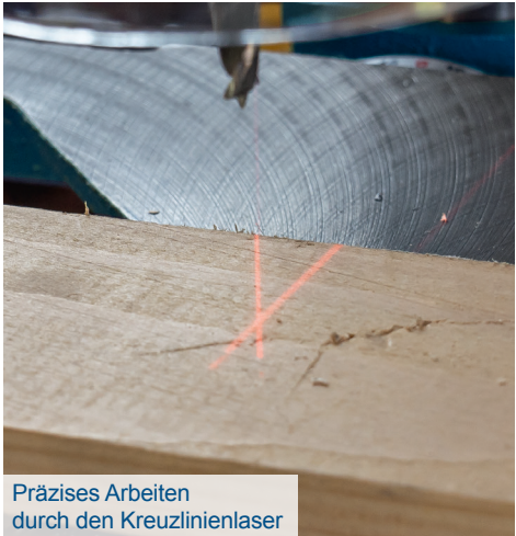
Präzises Arbeiten durch den Kreuzlinienlaser