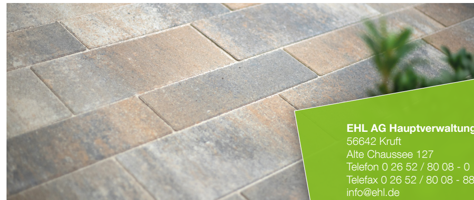
Farbe // muschelkalk

Verlegebeispiele zum jeweiligen Produkt finden Sie auf www.ehl.de