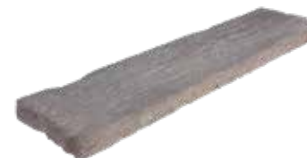
90 x 22,5 x 4,5 cm