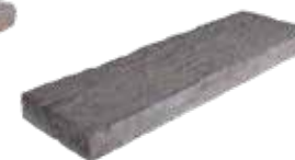
67,5 x 22,5 x 4-5 cm