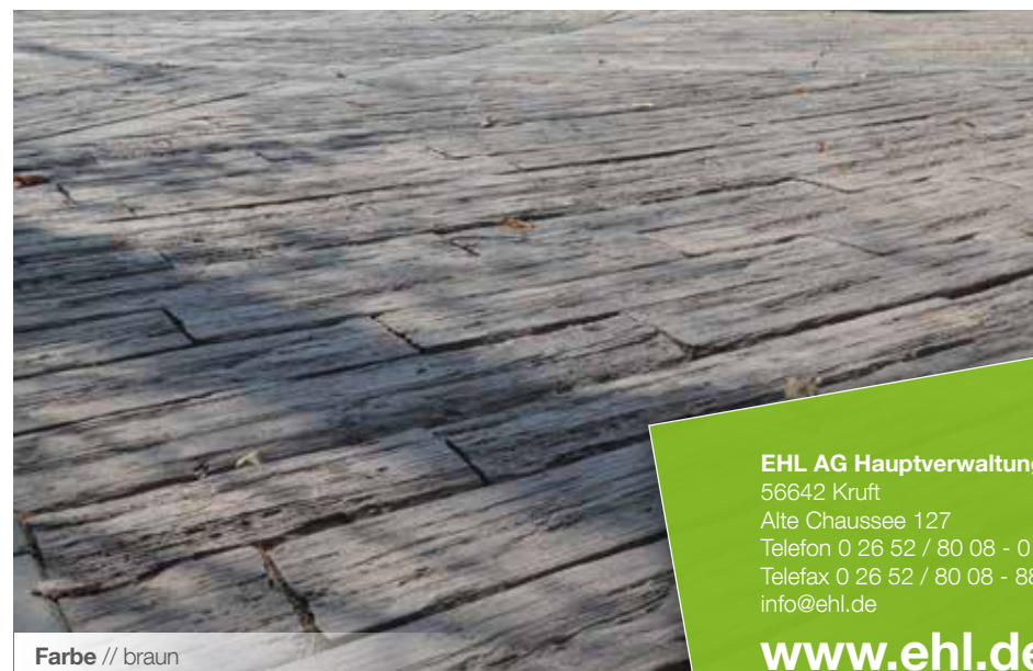
Farbe // braun

Verlegebeispiele zum jeweiligen Produkt finden Sie auf www.ehl-for-diy.de