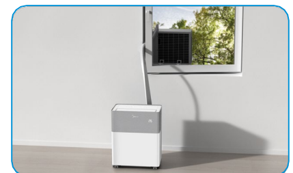
In Betrieb nehmen