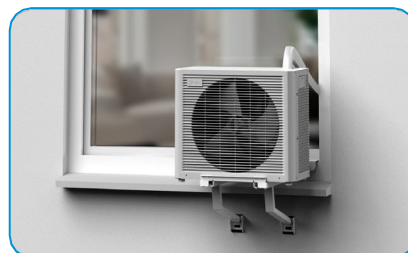
Das Außengerät auf die Halterung setzen