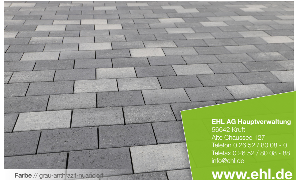
Farbe // grau-anthrazit-nuanciert

Verlegebeispiele zum jeweiligen Produkt finden Sie auf www.ehl-for-diy.de