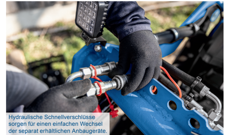
Hydraulische Schnellverschlüsse sorgen für einen einfachen Wechsel der separat erhältlichen Anbaugeräte.