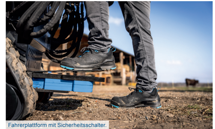
Fahrerplattform mit Sicherheitsschalter.