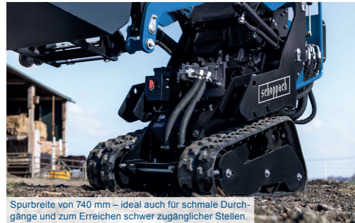
Spurbreite von 740 mm – ideal auch für schmale Durchgänge und zum Erreichen schwer zugänglicher Stellen.