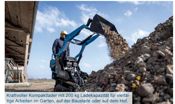
Kraftvoller Kompaktlader mit 200 kg Ladekapazität für vielfältige Arbeiten im Garten, auf der Baustelle oder auf dem Hof.