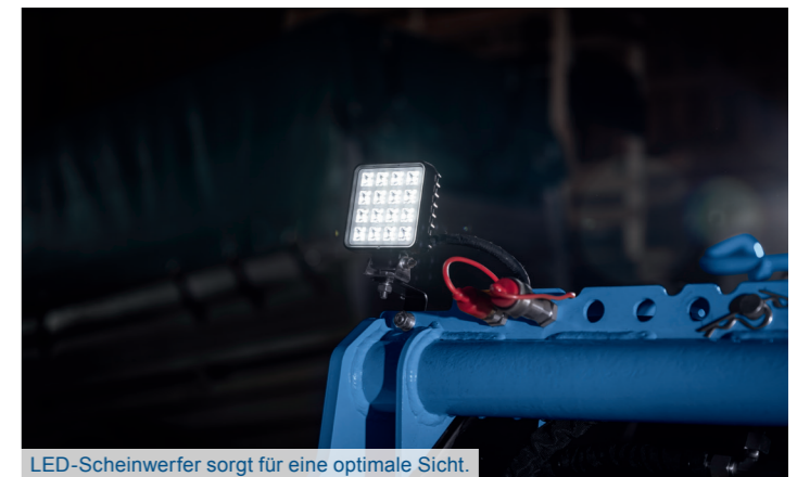
LED-Scheinwerfer sorgt für eine optimale Sicht.

4-Takt-Benzinmotor 306 cm³ / 8,5 PS / 6,3 kW