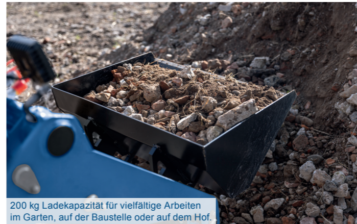
200 kg Ladekapazität für vielfältige Arbeiten im Garten, auf der Baustelle oder auf dem Hof.