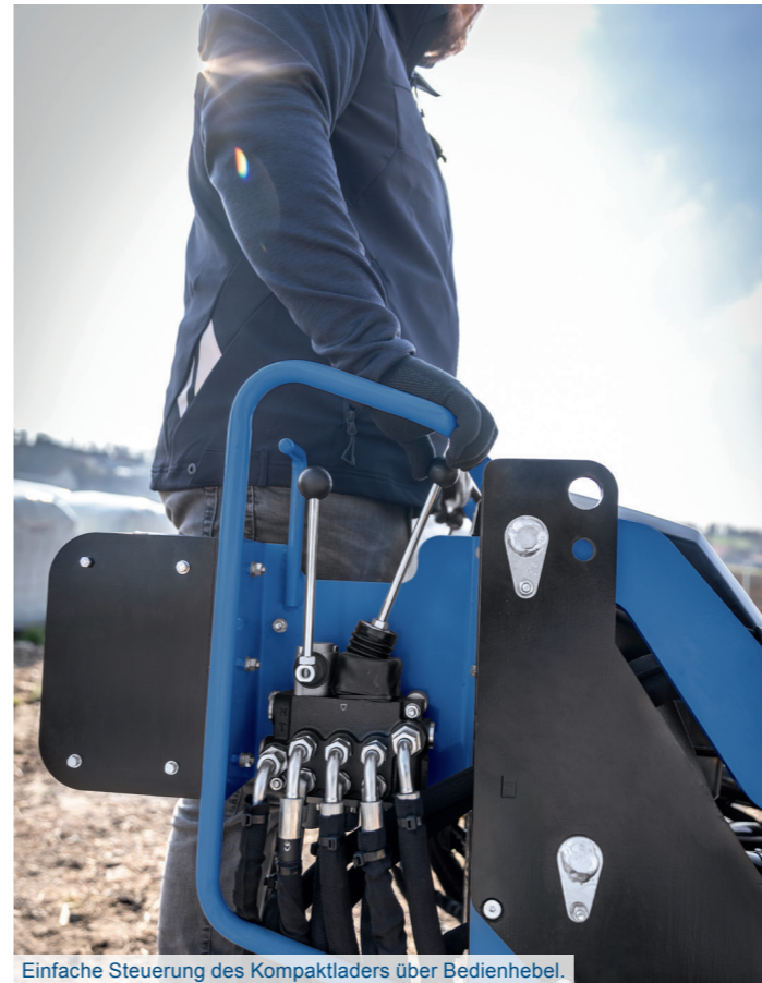
Einfache Steuerung des Kompaktladers über Bedienhebel.