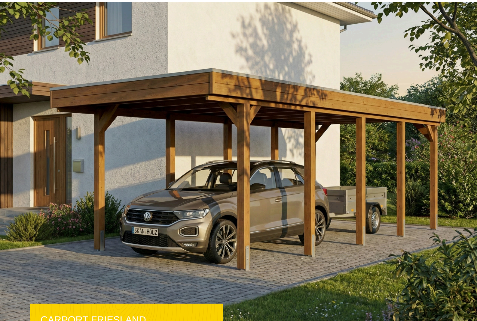
CARPORT FRIESLAND 320 x 860 cm