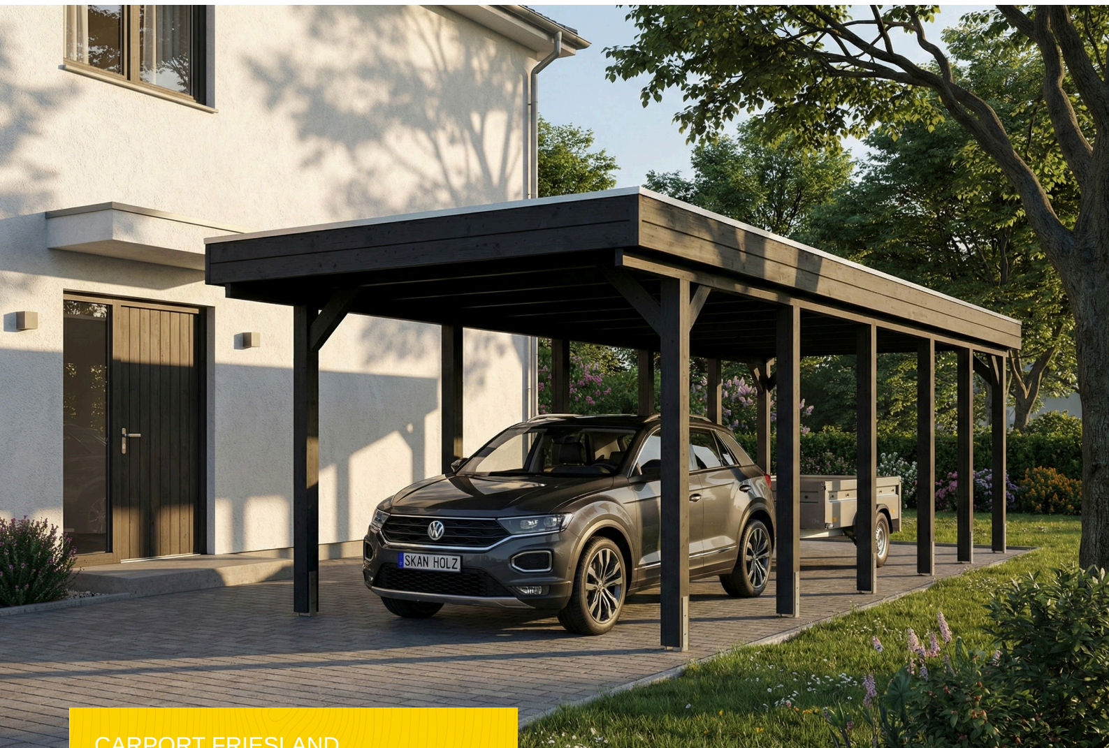
CARPORT FRIESLAND 320 x 860 cm