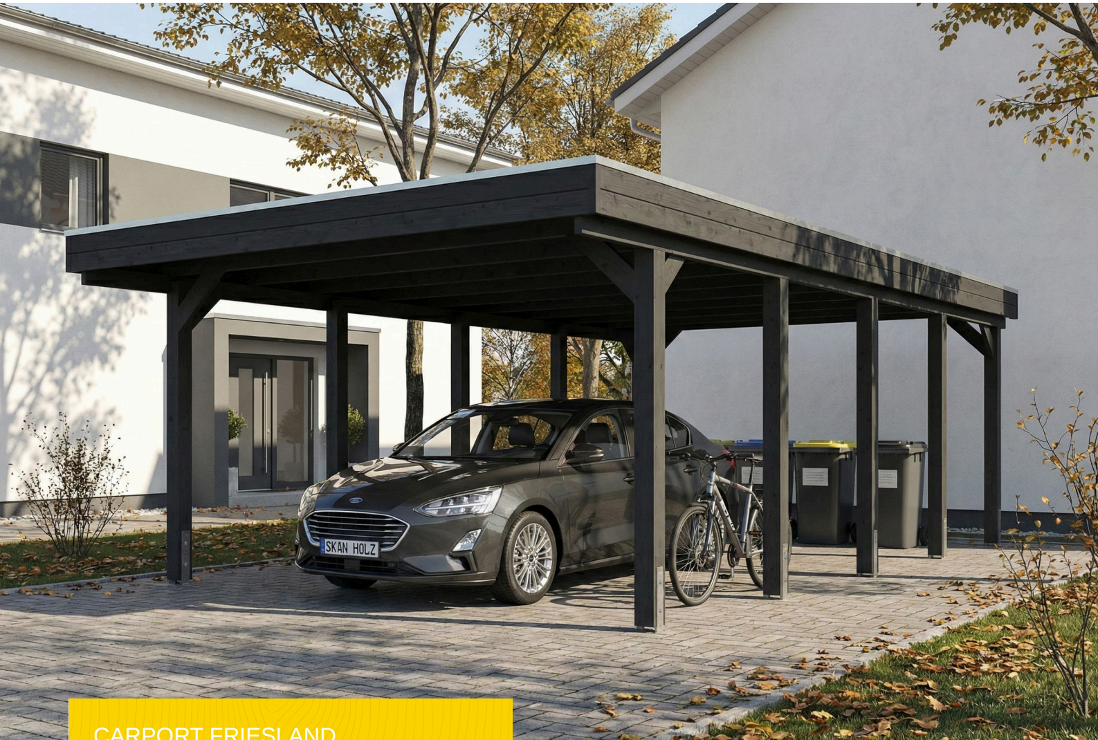
CARPORT FRIESLAND 402 x 708 cm