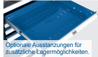
Optionale Ausstattungen für zusätzliche Lagermöglichkeiten.