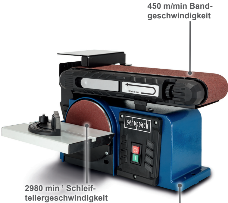
450 m/min Bandgeschwindigkeit