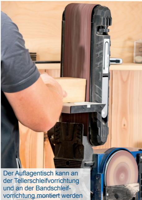
Der Auflagentisch kann an der Tellerschleifvorrichtung und an der Bandschleifvorrichtung montiert werden