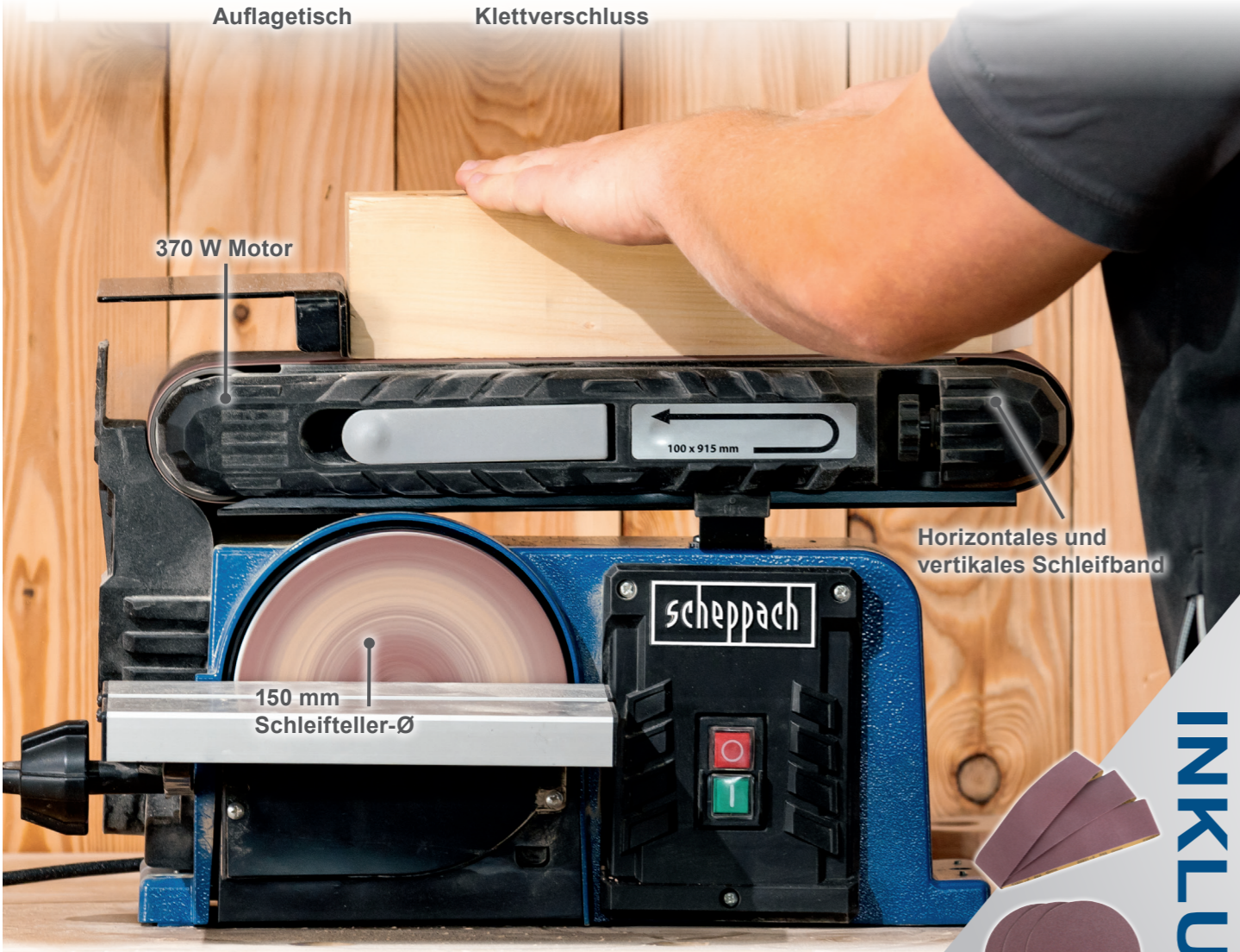
370 W Motor