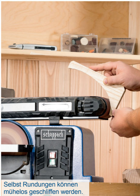
Selbst Rundungen können mühelos geschliffen werden.