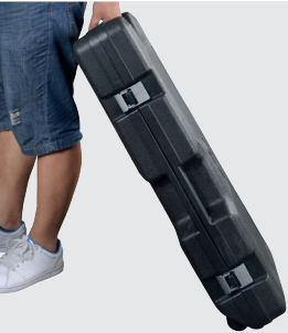
Transportkoffer mit Rollen

FLACHMEISSEL Ø 30 mm, L 390 mm Artikelnummer: 3908201108 EAN: 4046664014287 SPITZMEISSEL Ø 30 mm, L 390 mm Artikelnummer: 3908201109 EAN: 4046664014294