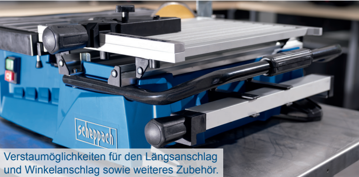
Verstaumöglichkeiten für den Längsanschlag und Winkelanschlag sowie weiteres Zubehör.