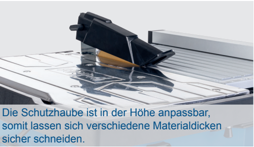
180 mm Ø Diamanttrennschneide