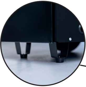
Vibrationsgedämpfte Standfüße ermöglichen sicheren Stand