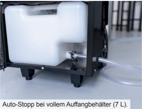
Auto-Stopp bei vollem Auffangbehälter (7 L).