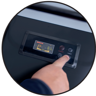
LCD-Display zur komfortablen Geräteeinstellung