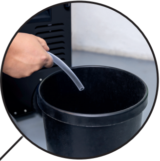
Selbstentleerung über einen anschließbaren Schlauch