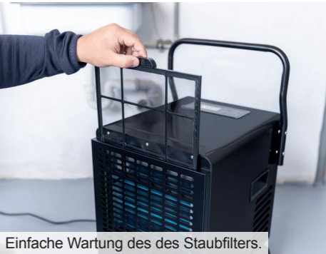
Einfache Wartung des des Staubfilters.