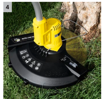
4 Praktischer Pflanzenschutzbügel