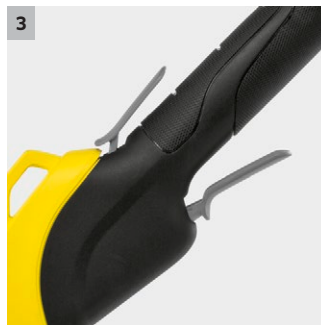
3 Stufenlose Geschwindigkeitsregulierung