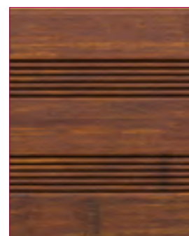
Geölt mit elephant® Bambuspflegeöl spezial

Bitte beachten Sie die natürliche Verwitterung