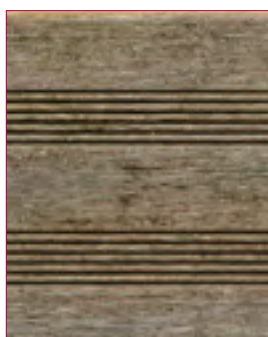
Verwittert nach ca. 1 Jahr im Außenbereich