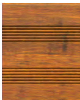
CoBAM® Exclusive - Select im Neuzustand