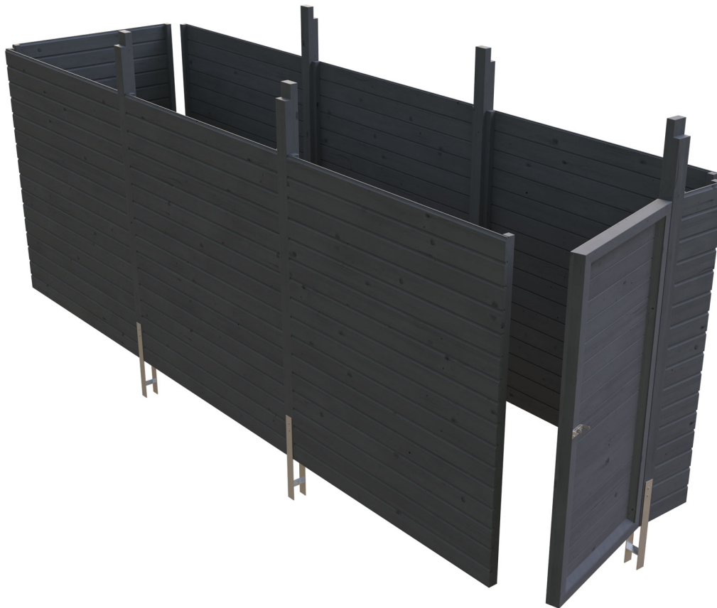
Produktbild Abstellraum C5