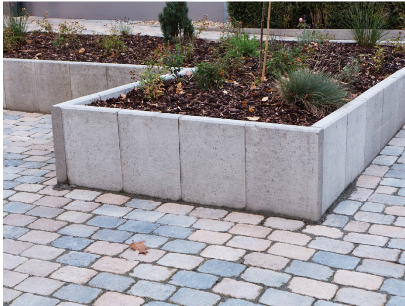
80 x 45 x 40 x 8 cm Grau