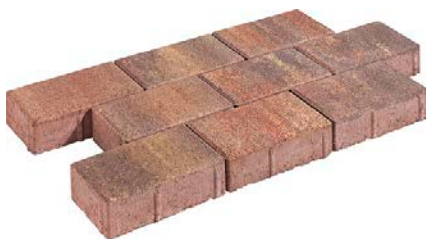
20 x 10 x 5 cm