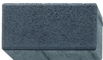
20 x 10 x 8 cm