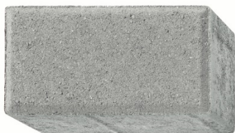
20 x 10 x 6 cm