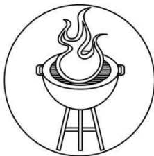
Auf einem Grill