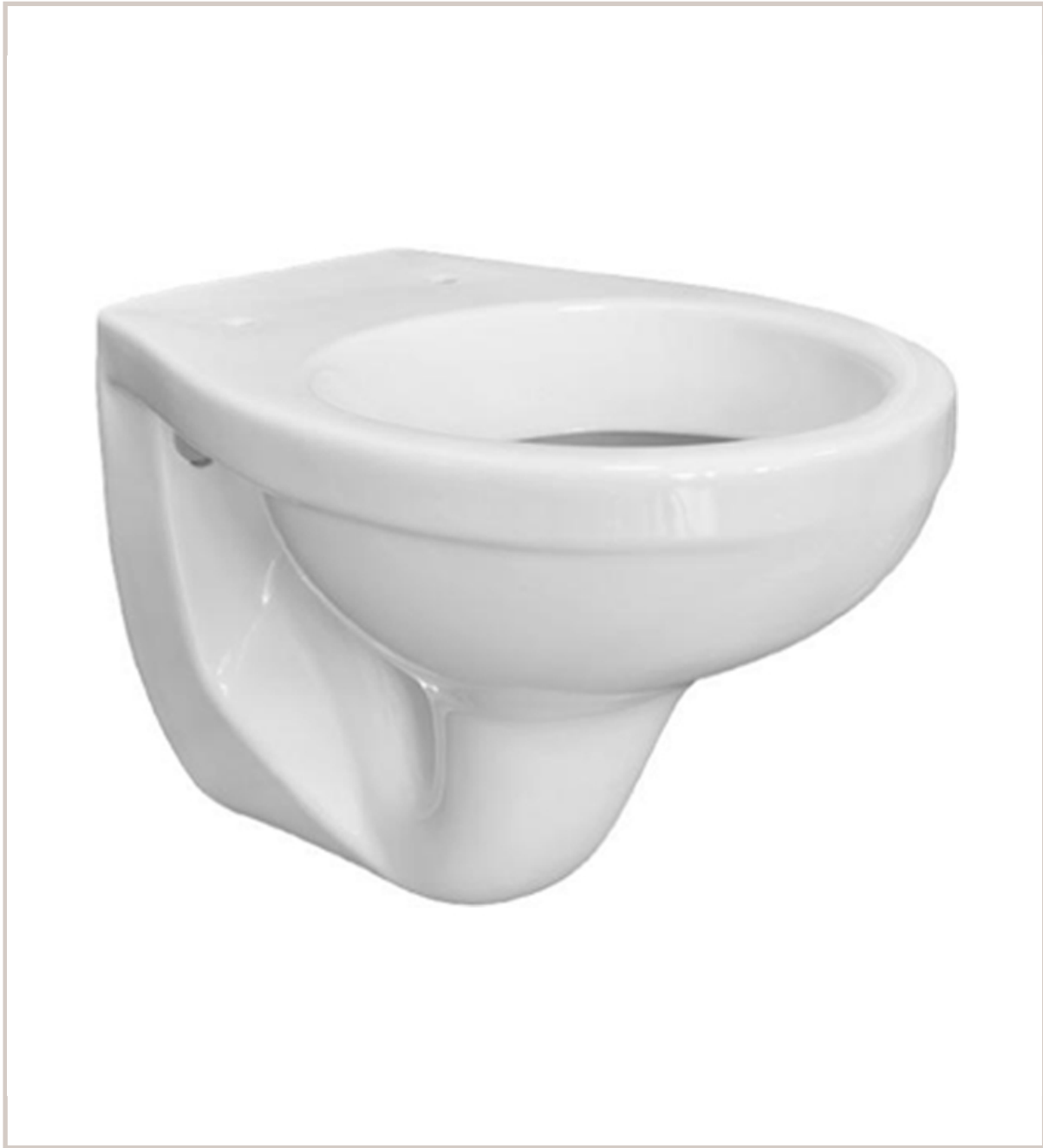
Wand WC „DNP“ weiß