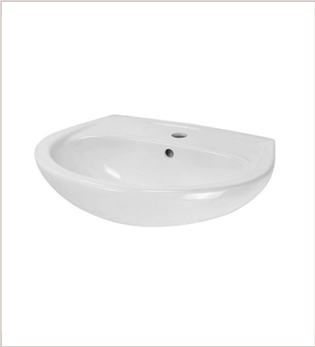
Waschtisch „DNP“ 60 cm