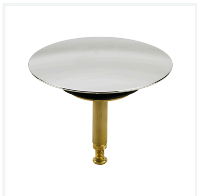
Ventilkegel - für Multiplex, Multiplex Trio Modell 6168-035