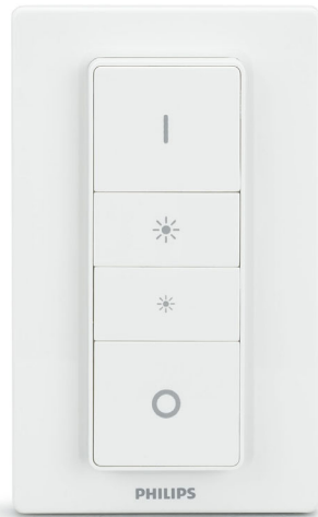
Philips Hue Dimmschalter