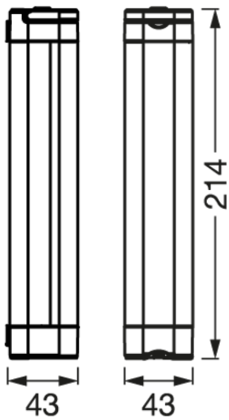
PGLINEAR LED TASK LIGHT 200MM IP54 WTMiPRCmnk