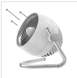
BEWEGT DIE RAUMLUFT BIS ZU 20 M WEIT