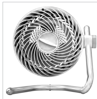
STANDFUSS VERTIKAL EINSTELLBAR