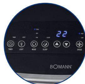
Multifunktions-Bedienfeld inkl. LED-Display