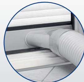
Inkl. Fenster-Kit und Abluftschlauch