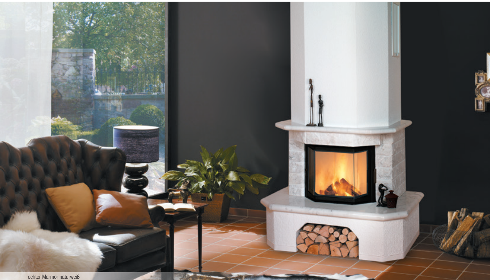
echter Marmor naturweiß