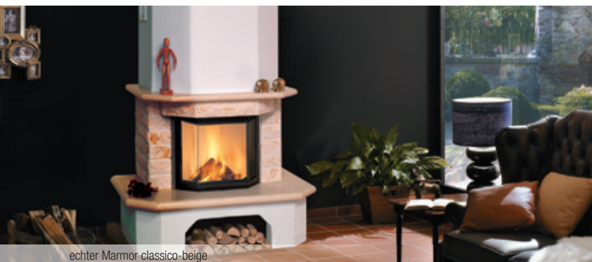
echter Marmor classico-beige